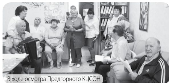
В ходе осмотра Предгорного КЦСОН.

Гости отметили высокий уровень работы специалистов Центра по внедрению системы долговременного ухода, новизна и актуальность внедрения стационарозамещающих технологий, программ активного долголетия. В ходе конструктивного разговора участники семинара обсудили важные вопросы взаимодействия с медицинскими организациями, волонтерами, другими участниками СДУ, обменялись мнениями об актуальности и особенностях внедрения системы в регионах России.